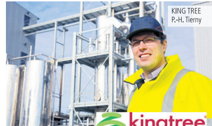
KING TREE P.-H. Tierny

Aujourd'hui, la vente de ces biscuits se fait en épicerie fine, mais aussi dans les boutiques des châteaux, des musées et des offices de tourisme. Un site marchand en ligne est dans les projets.